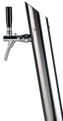
ART-LINE, schräg, 1-tlg.