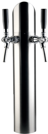
ART-LINE, gerade, 2-tlg.